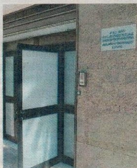
Il Centro riabilitazione